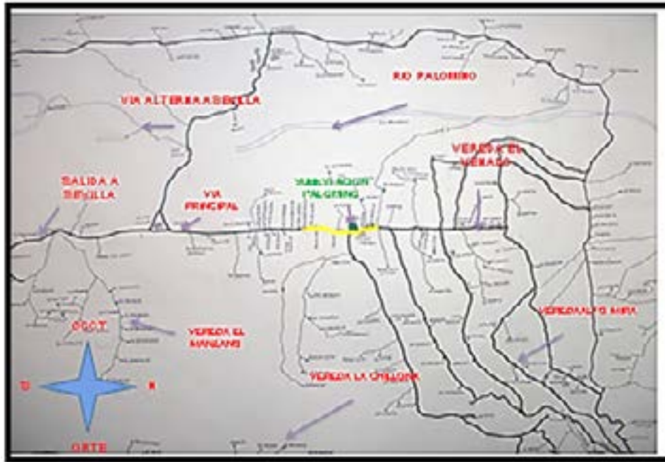
Figura 3, Georreferenciación corregimiento Palomino (Policía Nacional de Colombia, 2020)

Corregimiento Palomino (Sevilla – Valle del Cauca). Este corregimiento cuenta con una población urbana y rural de 425 habitantes aproximadamente, destacándose como principal labor económica la agricultura donde se distinguen agricultores y jornaleros.