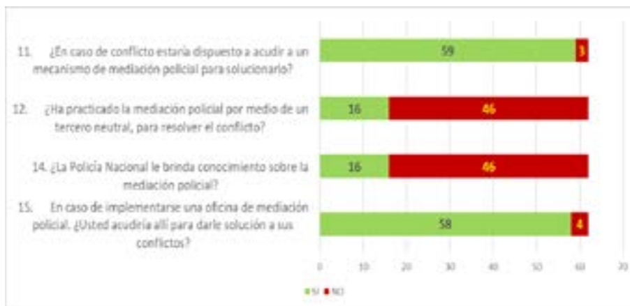
Figura 5, Comparativo datos asociados a la aceptabilidad de la mediación policial Corregimiento Palomino

Por otra parte, la mayoría de los encuestados manifestó que haría uso de los mecanismos de mediación policial para solucionar sus conflictos, sin embargo, no han practicado la mediación policial por medio de terceros neutrales. Este resultado contrasta con lo evidenciado en la vereda torres donde la mayoría de los involucrados en la muestra manifestaron que si han practicado la mediación policial por medio de terceros.