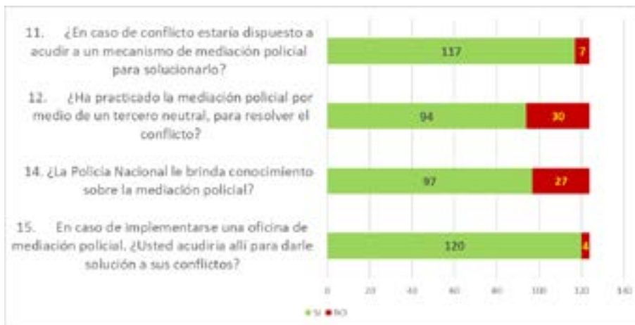
Figura 4, Comparativo datos asociados a la aceptabilidad de la mediación policial Vereda de Torres

en su aplicación si se tiene en cuenta la mayoría de los encuestados manifestó que recurre al diálogo para solucionar sus conflictos y que si conocen sobre la mediación policial. También se destaca que los encuestados muestran una tendencia mayor a emplear el dialogo cuando la contraparte corresponde a miembros más antiguos o a familiares, situación que no ocurre cuando se trata de conflictos con autoridades.