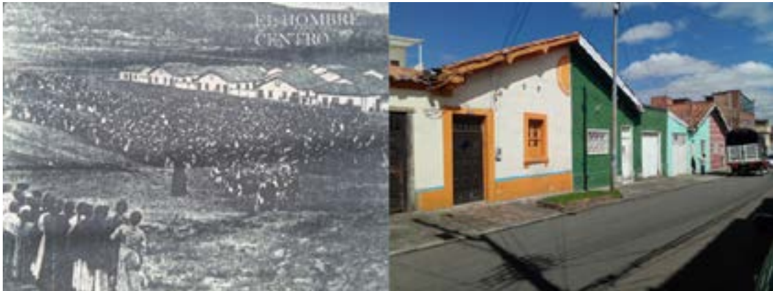
Foto en forma de espejo del barrio Villa Javier.