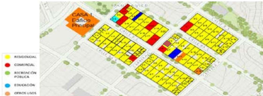
Figura 2. Levantamiento gráfico mapa de usos de las 5 manzanas de inicio del barrio Villa Javier.

Levantamiento gráfico mapa de usos de las 5 manzanas de inicio del barrio Villa Javier.