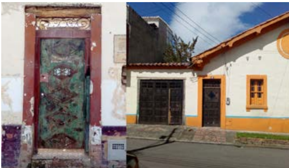
Detalles conservados de las fachadas