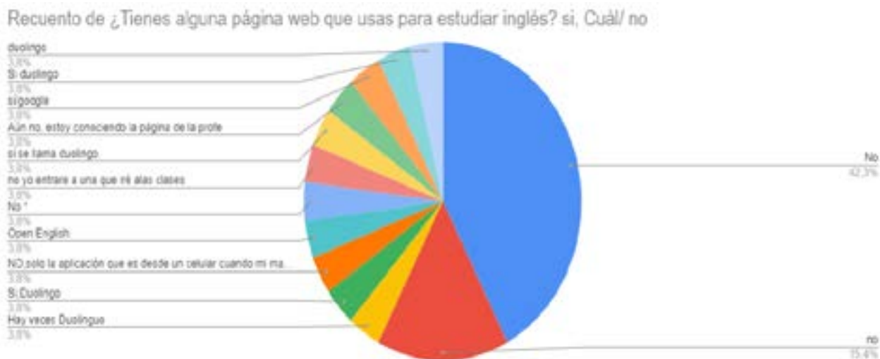
Tabla 2. Uso de las TIC en el aprendizaje del inglés