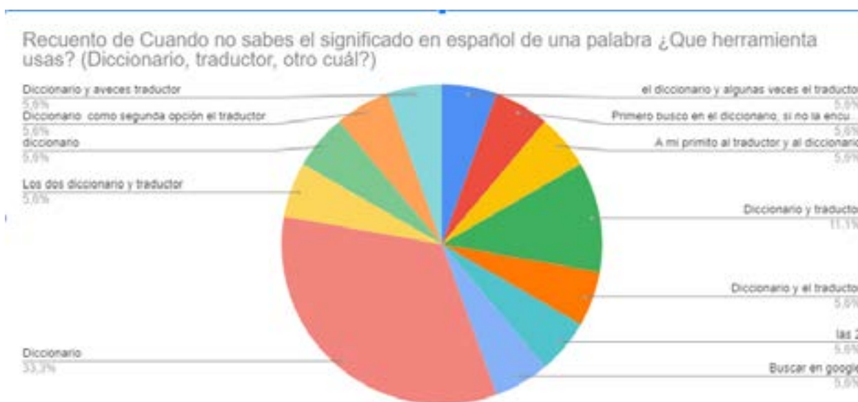
Tabla 1. Resolución de tasks de escritura

En el siguiente diagrama se observa las respuestas proporcionadas por los estudiantes sobre cómo completan tasks de escritura.