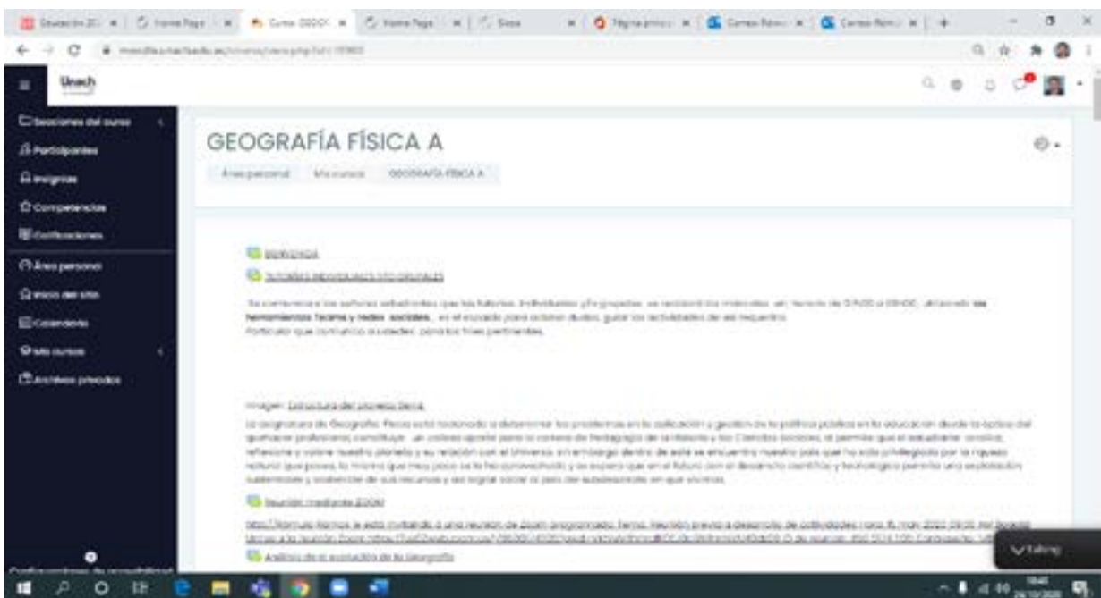
Figuras N.1, 2, 3: Contenido aula virtual Geografía Física

El aula virtual de la asignatura de Geografía Física, creada: