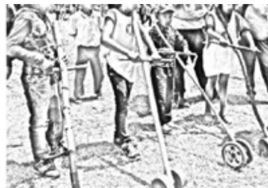
Imagen 2. Chanchiku o Carreto

Para poder jugar este juego se necesita madera de motilón o de cerote del páramo y dos ruedas. Al palo de madera se le atraviesa un palo de madera en el tercio superior, en la parte inferior se le atraviesa uno más pequeño en el cual van las dos ruedas.