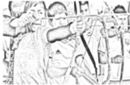
Imagen 4. Lasrúarúk o Arco y flecha

Para poder jugar este juego se necesita arco, flechas y tablero.