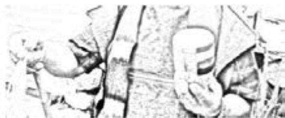
Imagen 1. Tsarap Lulepik o Zarambico.

Para poder jugar este juego, se necesita un zarambico o trompo adaptado, un palo de madera pequeño al que se le clava una guasca y varias cabuyas. El zarambico y la guasca deben ser elaboradas de madera de cerote de páramo o de encenillo.