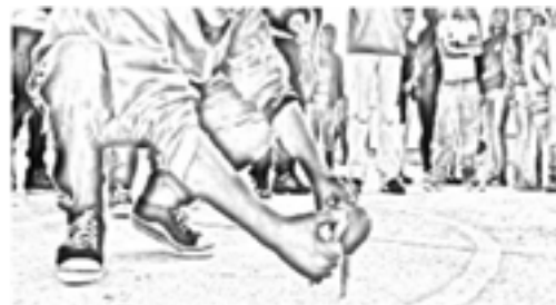
Imagen 5. Dchama o Zumbambico

Para poder jugar este juego se necesita madera y cabuya.