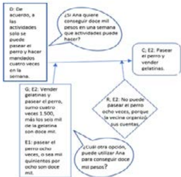
Imagen 4. Clase síncrona: Problema presentado (izquierda) y estructura argumentativa (derecha)