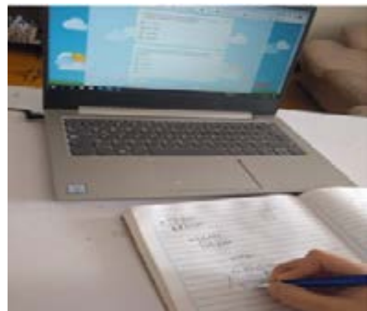
Imagen 3. Actividad 1 del módulo Necesidades y deseos .