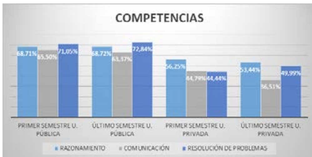
Figura 1. Resultados por competencias de los 4 grupos de estudio.

Analizando las competencias, se observa en la figura 1 que los resultados comparados entre las dos universidades son muy diferentes entre sí. En la universidad pública los niveles de desempeño de los estudiantes están entre satisfactorio y avanzado. En el caso de la privada esos niveles están entre mínimo y satisfactorio; además, el orden de las competencias en cada universidad es diferente, sin embargo, si comparamos los resultados obtenidos por estudiantes de primer semestre y último semestre de la misma universidad, sí tienden a ser muy similares entre ellos.