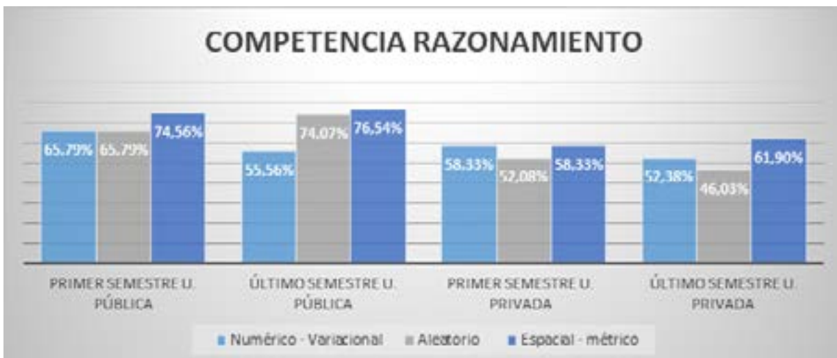
Figura 2. Resultados de los componentes en la competencia razonamiento.

Como se observa en la figura 2, el componente más alto de la competencia de razonamiento en los 4 grupos es el espacial–métrico, el cual, para los estudiantes de la universidad pública, tiene un nivel de desempeño avanzado y, en el caso de los estudiantes de la privada, es satisfactorio. En cuanto a los otros componentes, se observa que el numérico–variacional en los cuatro grupos alcanza un nivel de desempeño satisfactorio. En los estudiantes de la universidad privada es el segundo componente después de espacial–métrico, mientras en los estudiantes de la pública tiende a ser el tercer componente después de numérico–variacional, y aleatorio. En el caso del componente aleatorio, es el que muestra resultados más variables, ya que en los cuatro grupos alcanza niveles de desempeño muy diferentes, que van desde el avanzado hasta el mínimo.