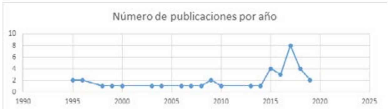
Figura 3. Número de publicaciones por año entre 1995 y 2020.

En referencia al número de publicaciones por año, esta permanece constante entre 1995 y 2014, a partir de 2015 se observa un interés creciente en la temática, siendo el año 2017 el de mayor publicación.