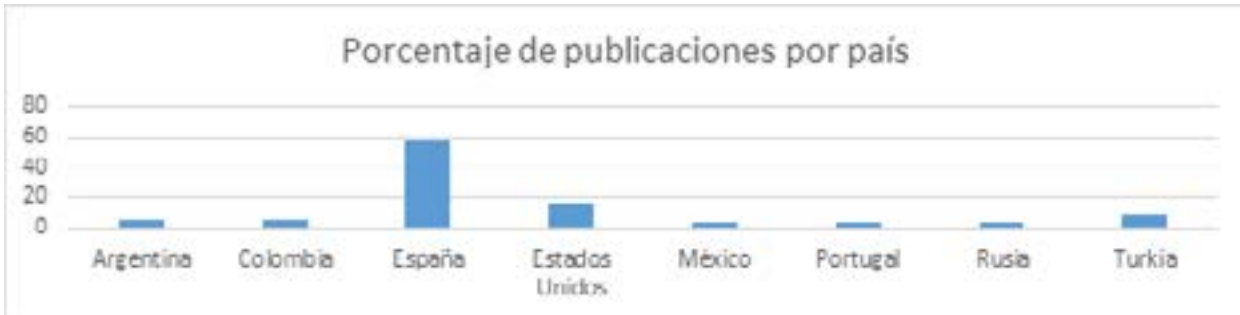
Figura 2. Porcentaje de publicaciones por país.

Respecto al país de origen de la publicación, se reconoce que España lidera la producción científica en la temática con el 58% (n= 22), le sigue Estados Unidos, con 16% (n=13), y Turquía con 8% (n=3) (Ver figura 2).