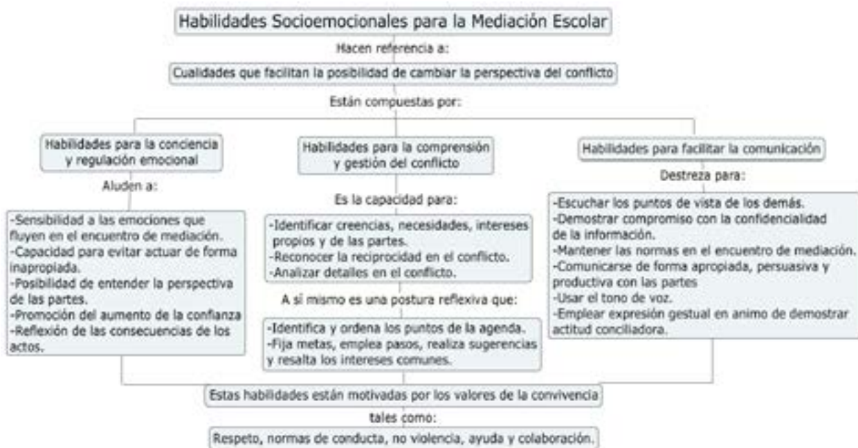
Figura 4. “Las habilidades socio-emocionales para la mediación escolar” y sus dimensiones.

conciliador pero aplacado, permitiría un mejor proceso. Complementariamente un mediador debe desarrollar la habilidad para hacer pedidos claros, responder creativamente a la crítica, como también emplear modos proxémicos no verbales conciliadores no amenazantes (López, 2016; Serrano et al., 2007; Zambrano, 2015).