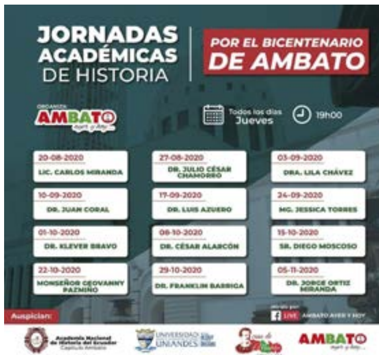
Diseño del afiche: Jornadas Académicas por el Bicentenario