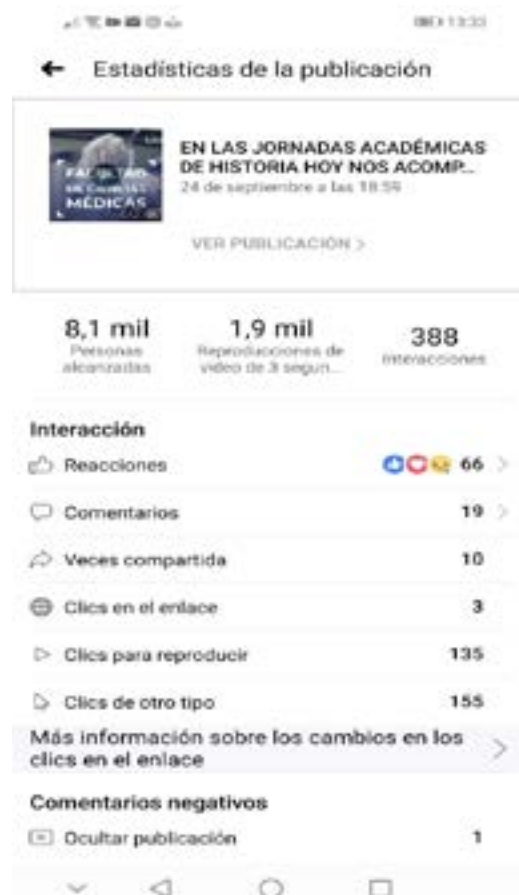
Imagen 4: Evaluación de resultados

En el 2020, nos insertamos en ese marco de celebraciones bicentenarias en un contexto de pandemia. Esta ocasión se necesitan alianzas entre instituciones, modificar las plataformas de interacción e incluir nuevas voces que nos ofrezcan nuevas miradas sobre la celebración del bicentenario. Las Jornadas Académicas de Historia son un ejemplo efectivo de la divulgación científica desde sectores privados que se encuentran preocupados por la educación comunitaria.