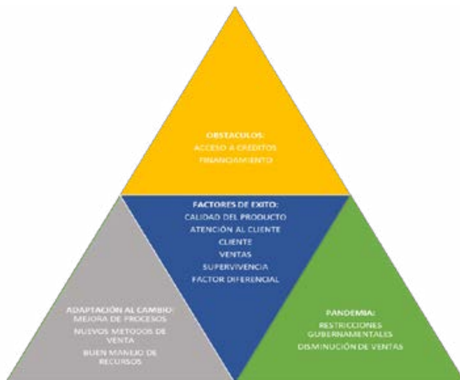
Figura 6. Identificación de factores del modelo

La información recopilada permitió establecer los elementos constitutivos del modelo conceptual, estos se generan a partir de cómo obtener el máximo beneficio, así como evitar acciones que limiten su permanencia en el mercado. (Figura 6)