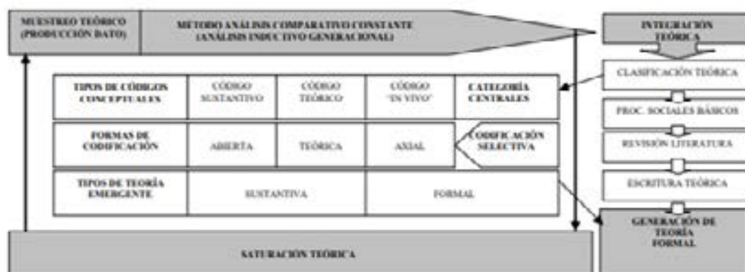
Figura 3. Componentes de un modelo

El muestreo teórico, el método de análisis comparativo constante, la saturación teórica, la clasificación teórica, el establecimiento de los procesos sociales básicos y la escritura teórica, componen los elementos dinámicos del modelo. (p. 36)