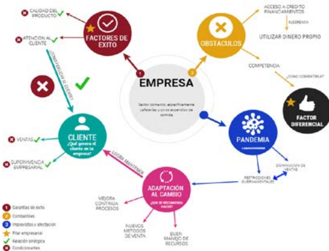
Figura 7. Modelo conceptual; Factores de éxito y obstáculos empresariales