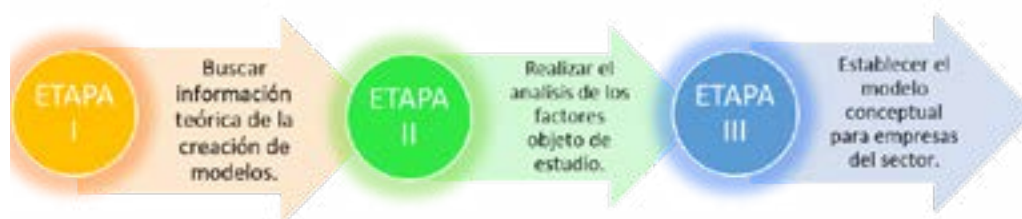
Figura 2 Fases de elaboración del modelo conceptual

El desarrollo del modelo se realizó en tres fases (figura 2)