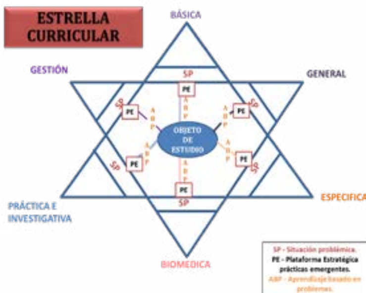
Figura 1. Estrella curricular nuevas tendencias (prácticas emergentes)

Las nuevas tendencias que se han definido por la validación de expertos (Cardona, 2018), como deportes alternativos y actividades físicas, recreativas no convencionales que están en auge, nacen a partir de la transformación de objetos o prácticas anteriores a las que se han dado un nuevo uso; varían de acuerdo a la localidad, y vienen surgiendo con la modernidad, la globalidad y la era digital líquida (pensamiento influenciado por la tecnología). Estas tendencias surgen espontáneamente y van configurando acciones que caracterizan y van haciendo parte del posmodernismo. La propuesta consiste en integrar las nuevas tendencias al currículum , es decir, integrar una acción a lo discursivo y teórico del currículum , innovando no solamente la teoría, sino también la misma aplicación. Esta innovación se realiza desde las nuevas tendencias deportivas que se van difundiendo en nuestra cultura. Se plantea la estrella curricular (figura 1) que explica cómo el currículum debe ser permeado con las nuevas dinámicas que están inmersas en la cultura, traídas por la innovación y la tecnología.