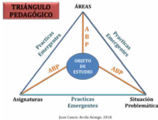
Figura 2. Modelo Triangulo Pedagógico nuevas tendencias (prácticas emergentes)

interdisciplinariedad dando vida a otras disciplinas que se derivan de otras. Ejemplo: la morfología, el crossfit , el padbol, el balonmano, entre otros.