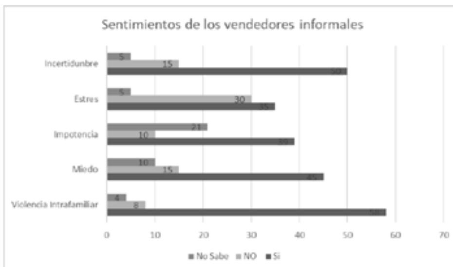
Imagen 1. Sentimientos de los vendedores informales. Elaboración Propia.

violencia y temores de contagio de COVID 19. La impresión de impotencia (55.71%) ante la pocas salidas comerciales y laborales, donde al descontento y sentimientos relacionados con el fracaso de la manutención de la familia son exteriorizadas. También el estrés (50 %) percibido por enojo, desasosiego frente a las responsabilidades, sensación de poca productividad. La incertidumbre emocional es la característica que tienen la mayoría de los participantes en tiempo de COVID-19 (71.42 %) dada la sensación de falta de seguridad, de soledad, desconfianza y poca certeza en el futuro próximo a estas personas ubicadas en este sector de la ciudad. (ver imagen 2)