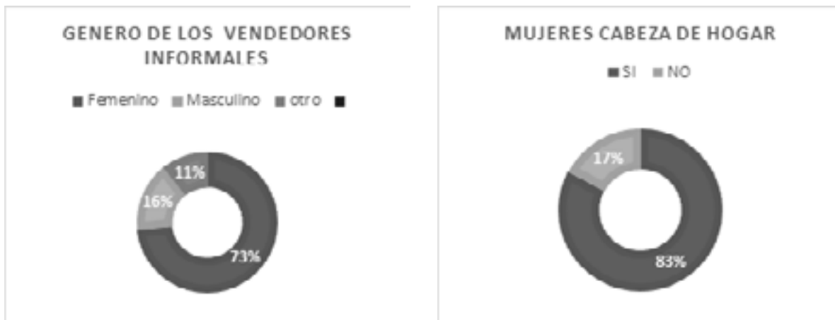
Imagen 1. Datos del perfil de los vendedores informales. Elaboración Propia.

El aumento de los vendedores informales sobre la avenida cero en cruces de la calle 13, calle 15 y calle 18 de la ciudad de Cúcuta, se vio de forma muy visible en la apropiación del lugar, revelando la usurpación indebida del espacio público en primera medida, pero más grave aún confirma la segregación y exclusión relacionada con las condiciones de género, así mismo en las informaciones obtenidas revela un alto número de casos de violencia intrafamiliar (82.85%) de tal suerte que las situaciones de apropiación del espacio público ponen de manifiesto sentimientos de miedo (64.28 %) caracterizada principalmente por preocupaciones y angustias permanentes por la situación económica, problemas de salud,