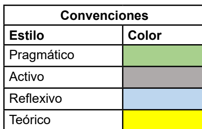
Cuadro 2. Tabulación de las características de los estilos de aprendizaje. Elaboración propia