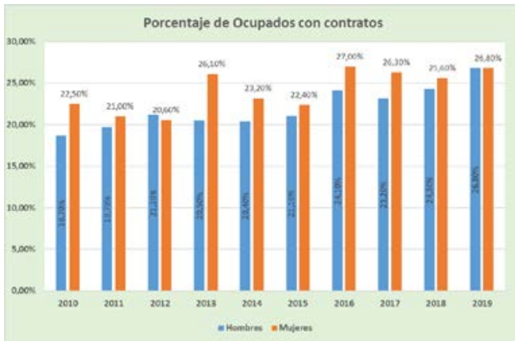
Grafica No. 2. Porcentaje de ocupados con contratos