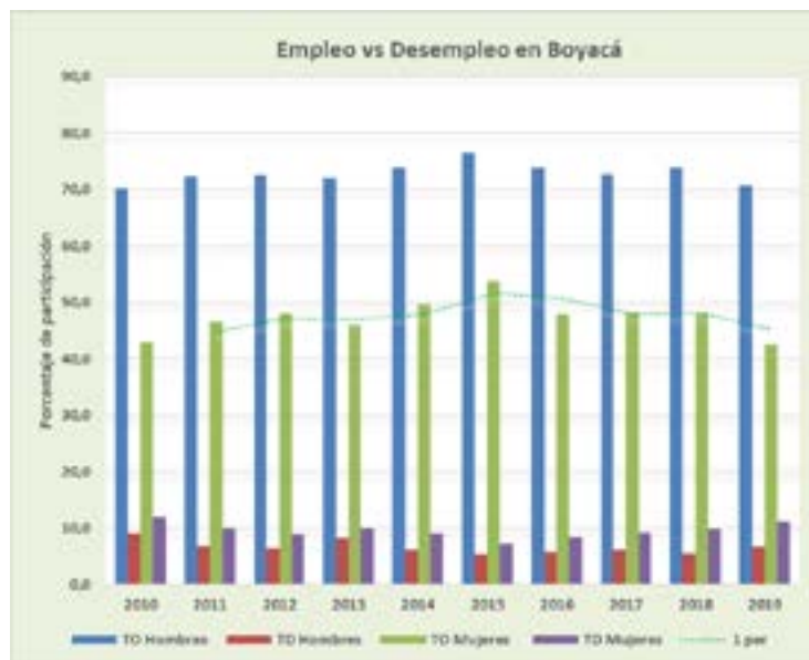
Gráfica 1. Empleo vs Desempleo en Boyacá