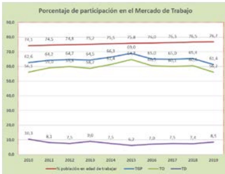
Grafica No. 3 Porcentaje de participación en el mercado de trabajo vs dinámica poblacional: Mercado de Trabajo.

En la Gráfica 3 se muestra el comportamiento del mercado de trabajo en el departamento de Boyacá, donde se discrimina la Tasa Global de Participación (TGP), Tasa de desocupados (TD), Tasa de Ocupados haciendo una comparación porcentual y del total de personas catalogadas como población en edad de trabajar (PET), población económicamente activa (PEA), población ocupada (OCU), población desocupada (DES) y población inactiva o fuera de la fuerza laboral (INI).