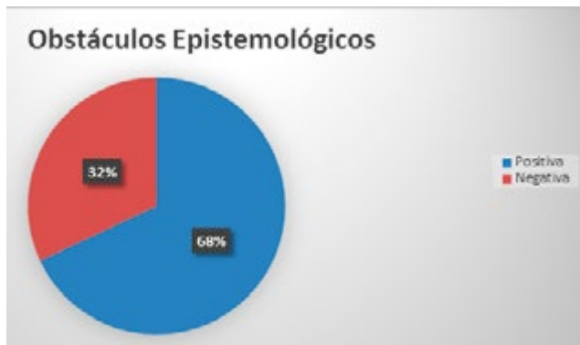
Tabla N° 2. Obstáculos Epistemológicos.

Elaboración propia, (García, Bolaños, Cifuentes, 2018)