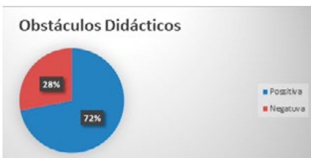
Tabla N°3. Obstáculos Didácticos.

Elaboración propia, (García, Bolaños, Cifuentes, 2018)