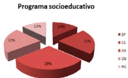
Grafica 1 Beneficios del programa socioeducativo de inclusión social