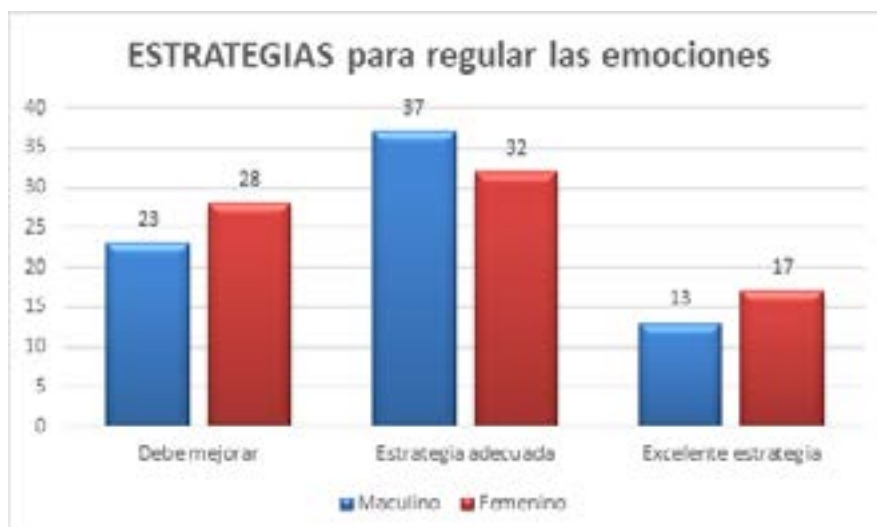
Figura 3. Gráfica que muestra el número de alumnos en las Estrategias empleadas para regular sus emociones con respecto al género

53.6% son hombres y 46.4% son mujeres. Por último, de los que gozan con una estrategia excelente en el manejo de las emociones son el 20%, que en su mayoría está representada por mujeres con un 56.7% y 43.3% por hombres.