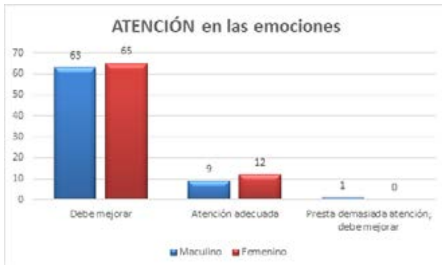
Figura 2. Gráfica que muestra el número de alumnos en la Atención que prestan a sus emociones con respecto al género.

El 14% tiene una atención adecuada de sus emociones, en su mayoría son mujeres con un 57.1% y 42.9% son hombres. Solamente 0.7%, siendo este un hombre, presenta demasiada atención, lo cual es también un problema.