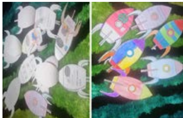
Foto 1. Presentación de la actividad del huerto en forma de nave espacial.

Una vez tomada la decisión de organizar un huerto se optó por seleccionar el espacio dentro del colegio donde se instalaría, el cual surge como una alternativa viable, pretexto para experimentar y aprender inglés de una manera dinámica, favorable e interesante; al comienzo, se organizó una actividad en forma de nave espacial, relacionada con la presentación del personaje Blue, para hacerla más creativa, tal como se ve en la foto 1