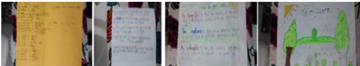
Foto 3. Muestra de textos construidos por los participantes.

Aquí, los estudiantes crearon situaciones relacionadas con su colegio, así como con los miembros de su familia, describiéndolas en inglés, para lo cual utilizaron algunos adjetivos que combinados con algunas estructuras básicas y con el vocabulario visto en clase, permitió a la investigadora impartir una charla, explicando la importancia de la utilización de un huerto escolar. Ver foto 3