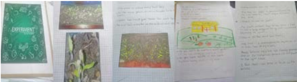
Foto 5. Foto del diario, así como de los posters producidos por los niños como resultado final de la experiencia.

Finalmente, el éxito de los diarios de campo elaborado por los participantes dio su fruto en los posters, donde quedó plasmado el proceso y el resultado final de la experiencia, como se observa en la foto 5.