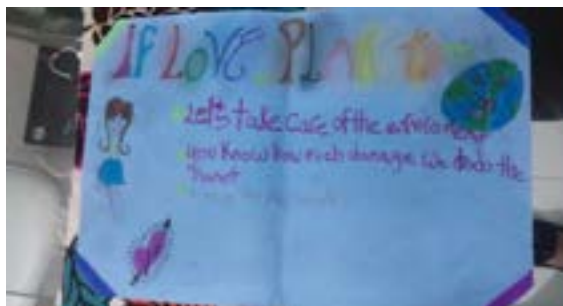
Foto 4. Muestra de posters hecho por los participantes.

poder comunicar sus ideas y percepciones sobre los problemas ambientales, en inglés, lo cual se puede apreciar en la foto 4.