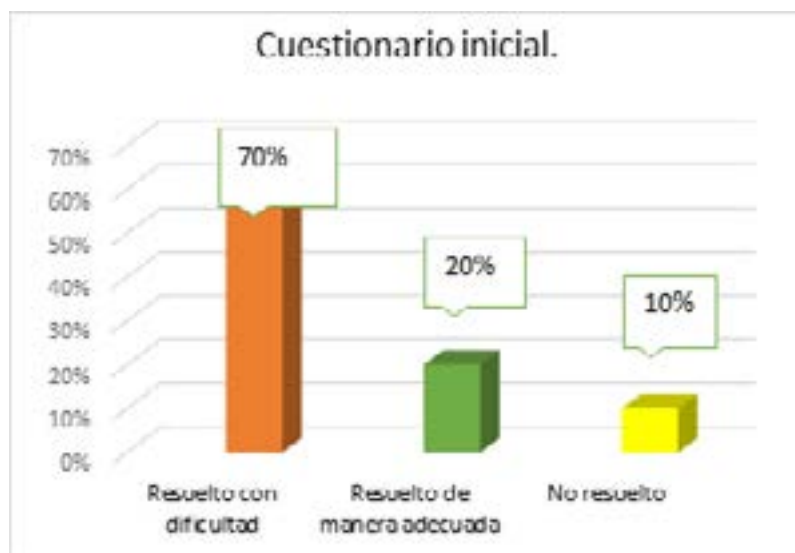
Gráfica 2. Solución de cuestionario inicial. Fuente: propia

Para definir el nivel de dominio de la lengua y de vocabulario de la lengua inglesa se aplicó un cuestionario inicial, dentro del cual, se evaluó el dominio de algunas estructuras básicas y el conocimiento del vocabulario relacionado con el huerto, observándose entre otros, los siguientes resultados, solamente el 20% pudieron resolverlo de manera adecuada, el 10 % de ellos decidió simplemente colorear y no resolver las preguntas planteadas, mientras el 70% no comprendió el contenido de los enunciados, correspondientes a las preguntas, estos resultados se evidencian en la gráfica 2, para el caso de los estudiantes que tuvieron muchas dificultades, la docente hizo un acompañamiento para intentar resolver las deficiencias detectadas.