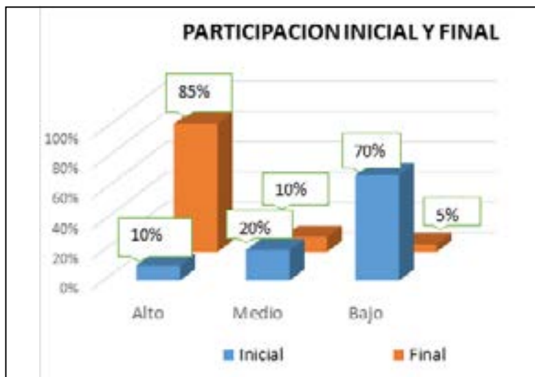
Gráfica 3. Participación inicial y final en la clase de inglés.

otra manera evidencia, que el trabajo producto de esta investigación es pertinente para apropiarse del idioma extranjero. (Ver gráfica 3)