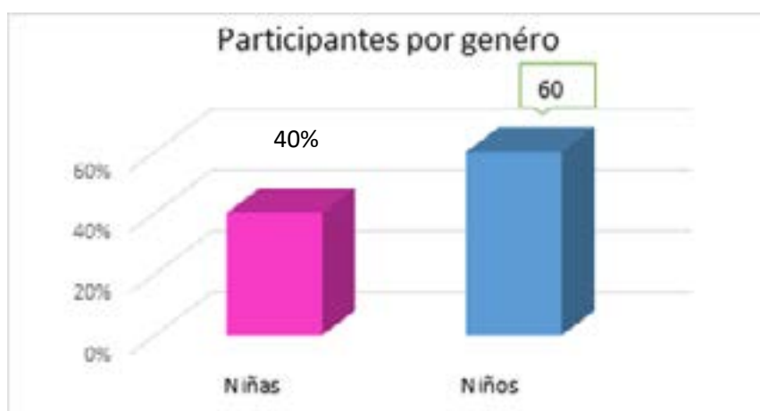
Gráfica 1. Participación por género

El Proyecto fue desarrollado en un colegio privado mixto de la localidad quinta (5) de Usme de la ciudad de Bogotá, cuyos estudiantes son de estrato socioeconómico de nivel 2, los participantes correspondientes a dos grupos de estudiantes del grado quinto, donde 40% eran niñas y 60% eran niños, tal como se aprecia en la gráfica 1, sus edades oscilaban entre 11 y 14 años.