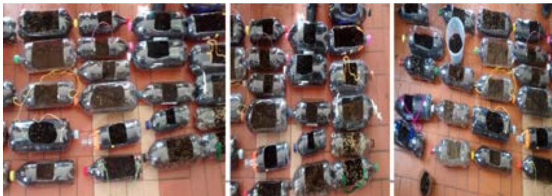
Foto 2. Presentación de la creación inicial del huerto.

y alimenticias como fresa y tomate cherry, considerando la sabiduría de los conceptos de la botánica, la agricultura y la ecología desde la visión humana, en los estudiantes, tal como se observa en la foto 2.